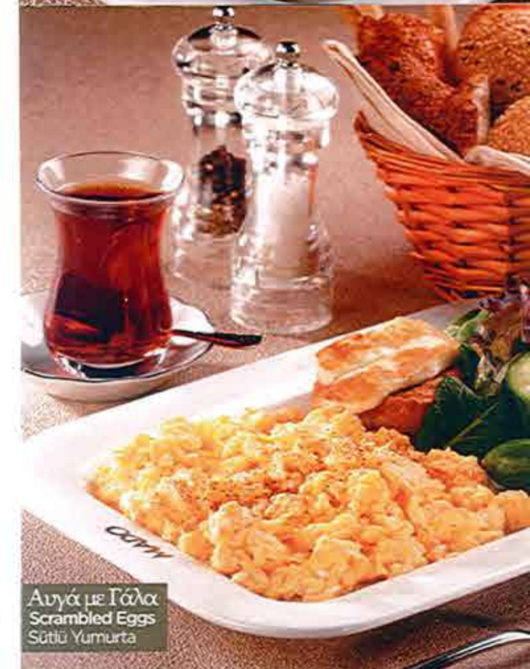
Αυγά με Γάλα Scrambled Eggs Sütlü Yumurta

Sütle çırpılmış üç yumurta, vanıdas kızarmış ekmek, kızgata hellim peyniri, yeşil yapraklar harmanı, salatalık ve kiraz domates ile