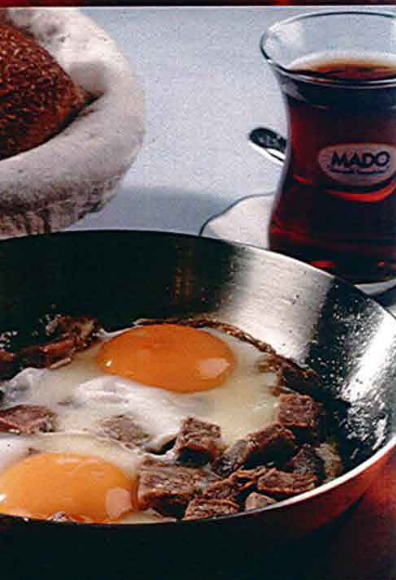
Αυγά Σαγανάκι με Καβουρμά Fried Eggs with Roasted Meat Sahanda Kavurmali Yumurta