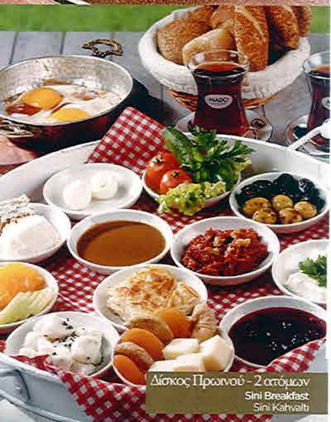
Δίσκος Πρωινού - 2 ατόμων Sini Breakfast Sini Kahvaltisi

Mado keciyoğurtlu, otlu yoğurtlu, taze soğanlı, kamaş, brynza, ızgara halloumi peyniri, tam yağlı beyaz peynir, taze soğan, kızılcık, kaymak, kekik, cevizli, taze zencefil, taze zencefil, yeşil ve siyah zeytin, kızartmis yufka biber, kızartmis patates ve etli dilim patates ile, kızartmis yufka biber, kızartmis patates ve etli dilim patates ile