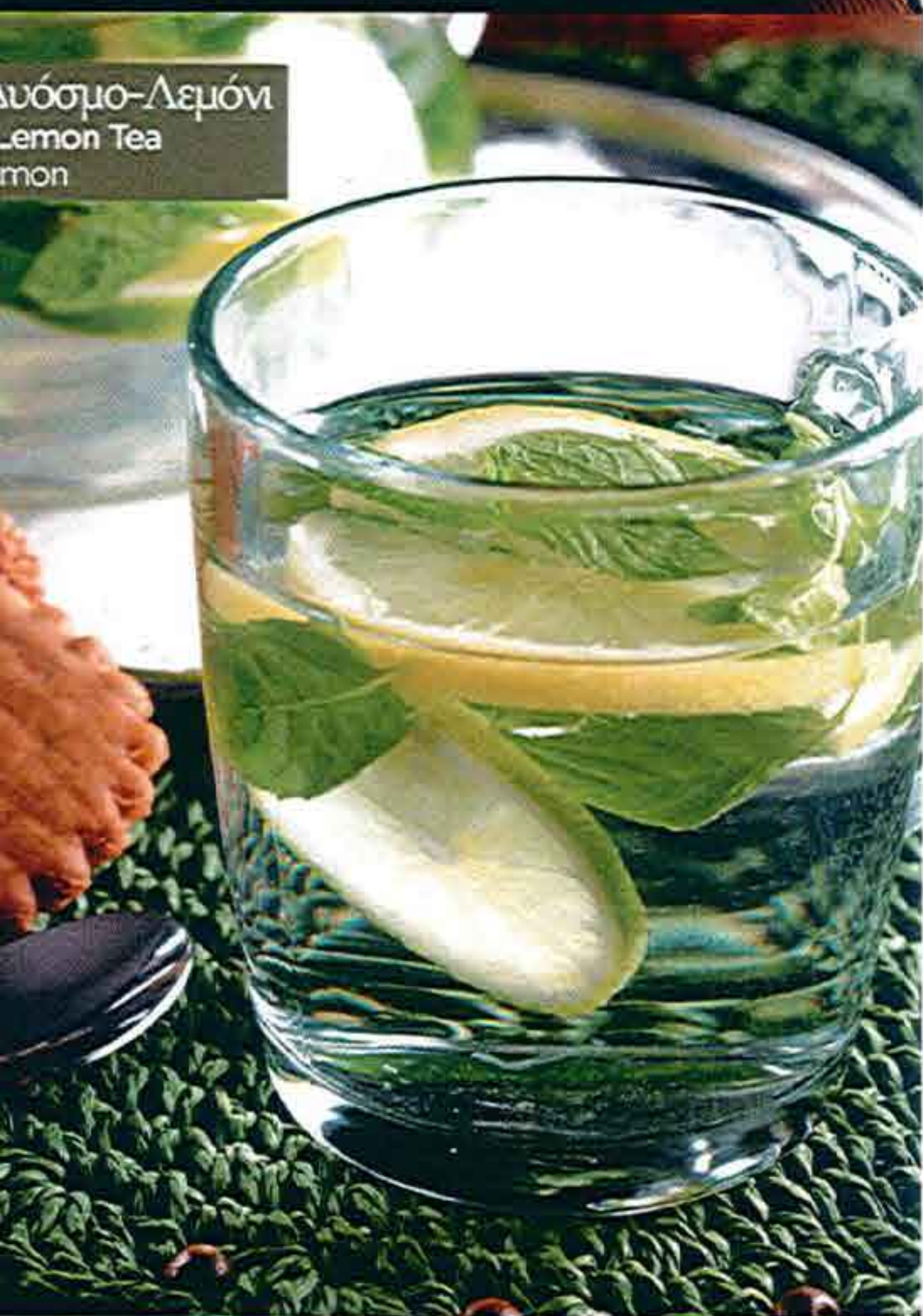
Δυόσμο-Λεμόνι Mint & Lemon Tea Nane Limon

3,90 € Πράσινο Τσάι με Γιασεμί Jasmine Green Tea Yasemini Yeşil Çay