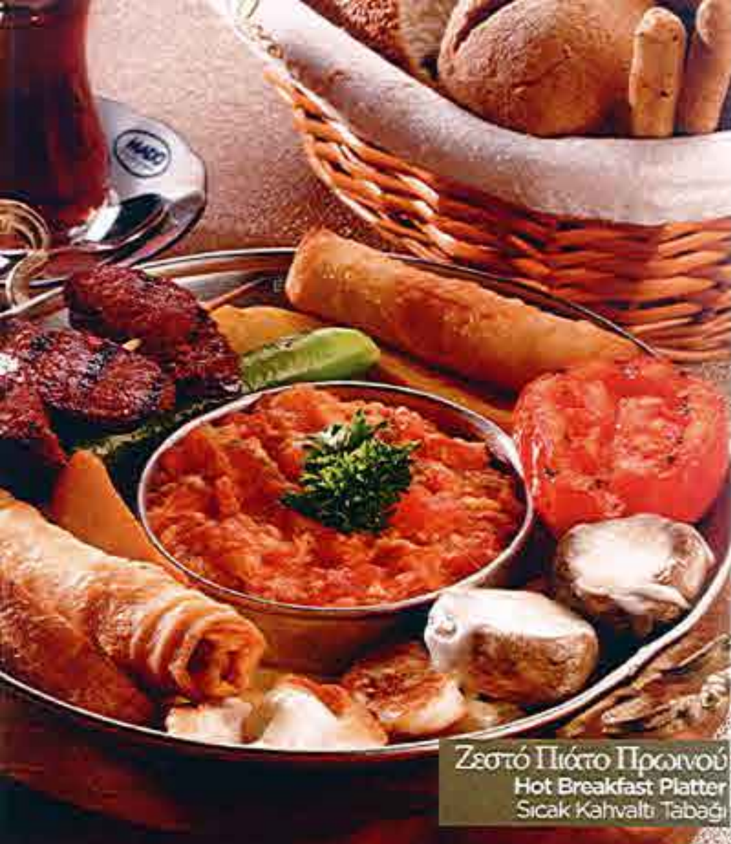
Ζεστό Πιάτο Πρωινού Hot Breakfast Platter Sıcak Kahvaltı Tabagi