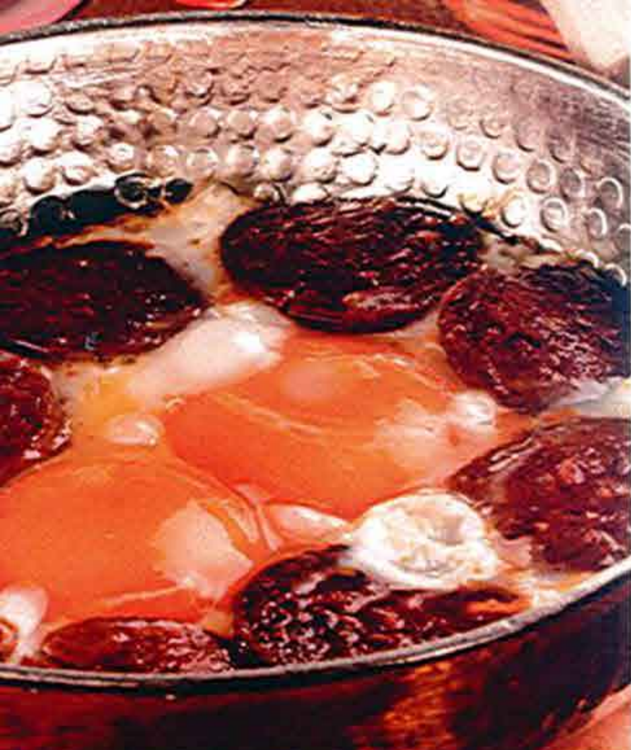
Αυγά Σαγανάκι με Σουτζούκι Fried Eggs with Beef Soujouk Sahanda Sucuklu Yumurta