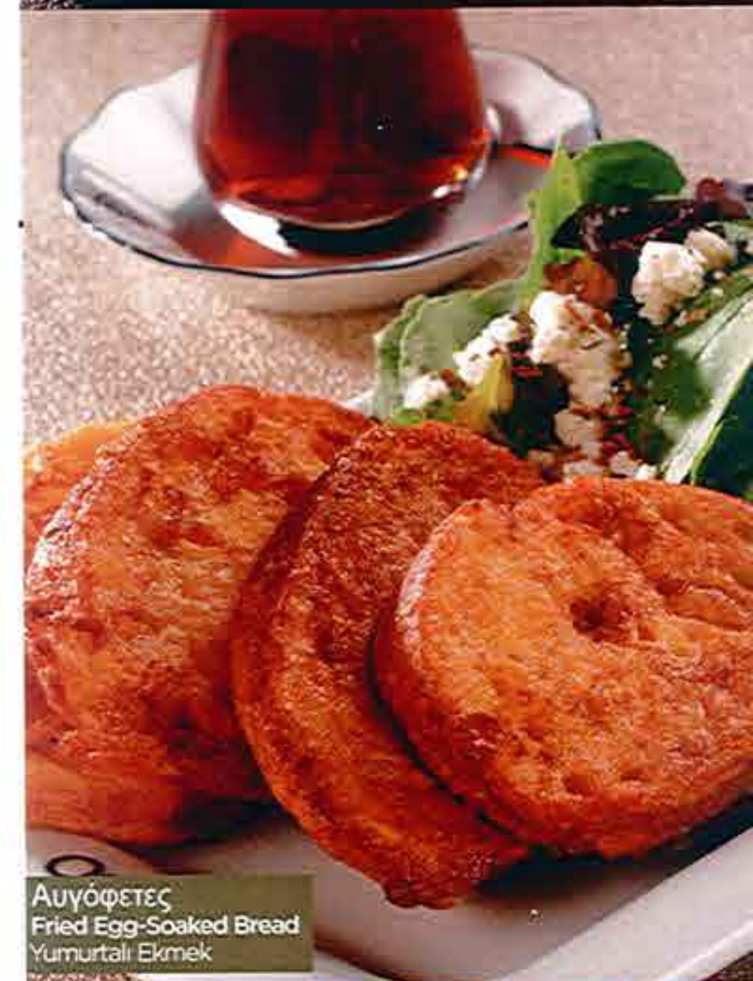
Αυγόφτετες Fried Egg-Soaked Bread Yumurtalı Ekmek

Kızartılmış dört dilim yumurtalı ekmek, tulum peyniri, yeşil yapraklar harmanı, salatalık ve kiraz domates ile