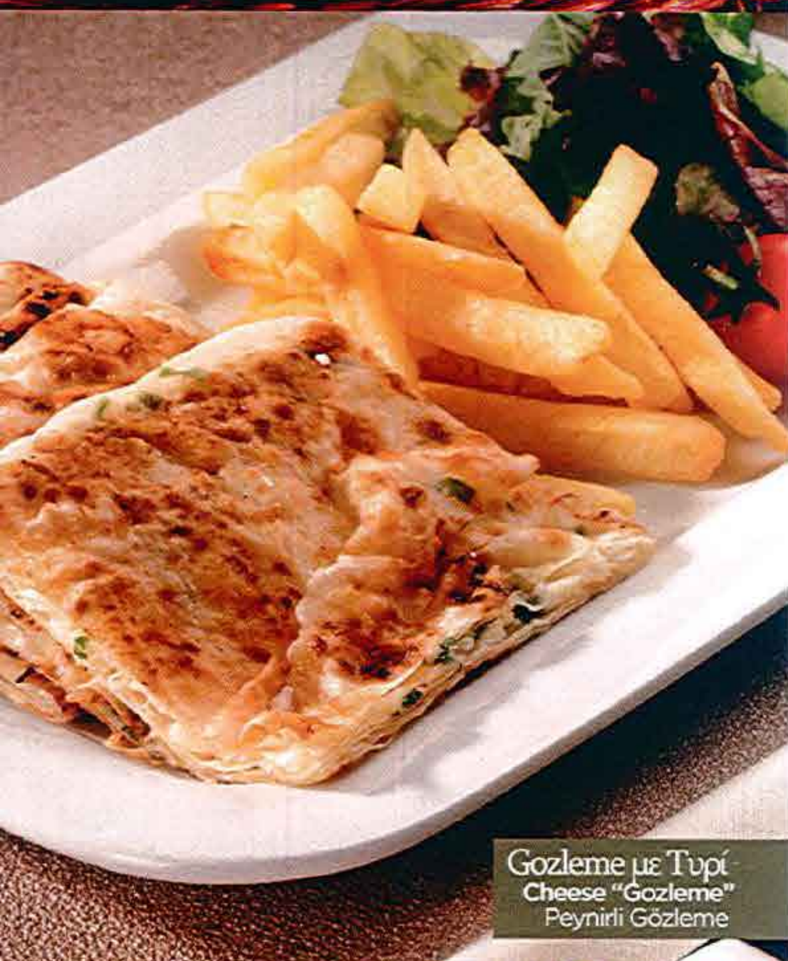
Gozleme με Τυρί Cheese "Gozleme" Peynirli Gözleme

karşık ve tatlıları keyifli bir şekilde Maras peynirli su böreği ve beyaz peynirli su böreği yanında (400ml/10oz) 4 adet onerem, 400ml/10oz, 400ml/10oz