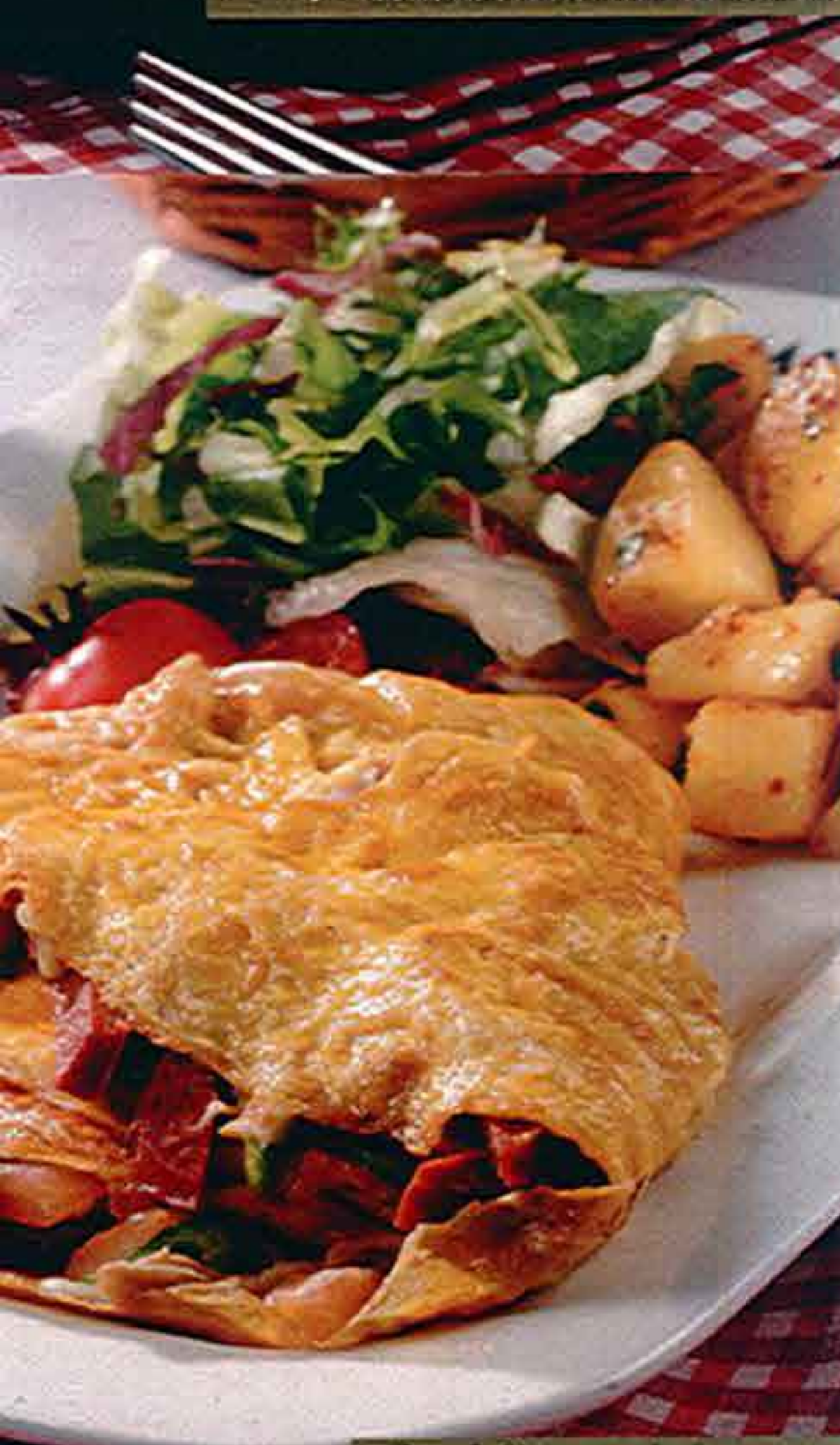
Ομελέτα με Διάφορα Mix Omelet Karışık Omlet