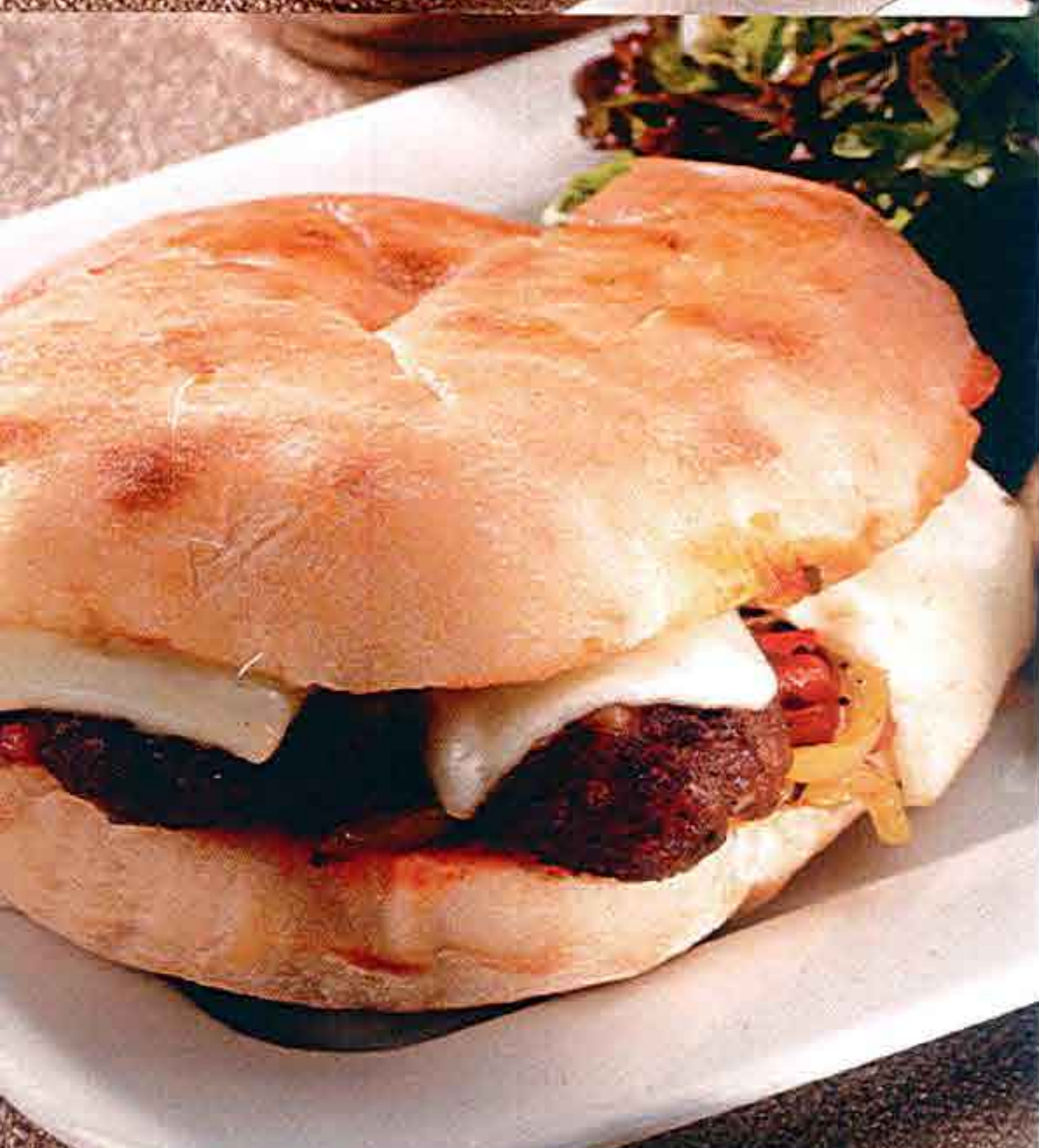
Σάντουιτς με Κεφτεδάκια Σχάρας Grilled Meatball Sandwich Izgara Köfteli Sandvic

Patates, kuru soğan ve kırmızı biber ile hazırlanan gozleme yeşil yapraklar harmanı, kiraz domates ve patates tava ile