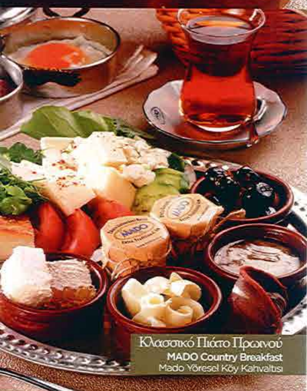
Κλασσικό Πιάτο Πρωινού MADO Country Breakfast Mado Yöresel Köy Kahvaltisi

İzgara soujuk, ızgara kasari mantar dolması, ızgara manas peyniri, ızgara-boregi, mini sahanda menemen, kızartmis yufka biber, kızartmis patates ve etli dilim patates ile