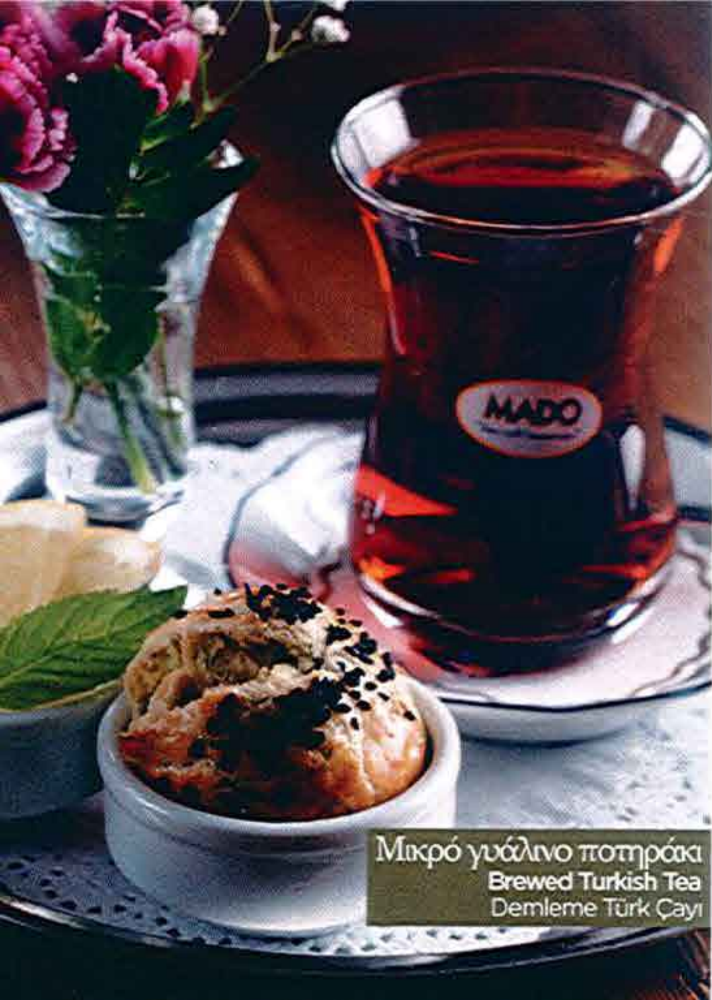
Μικρό γυάλινο ποτηράκι Brewed Turkish Tea Demleme Türk Çayı