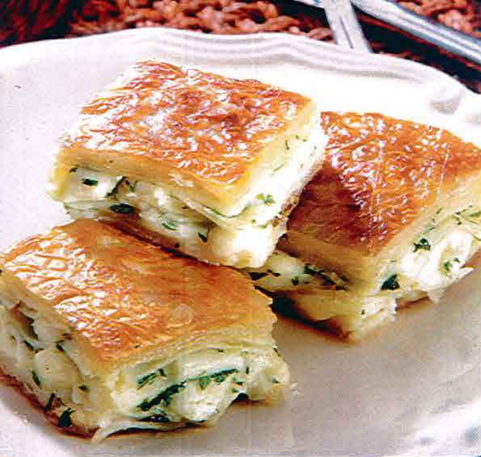
Su Μπουρέκι Σπιτικό με τυρί Maras ή Λευκό τυρί Home-made Su Borek with Maras Cheese or Feta Cheese Maras Peynirli veya Beyaz Peynirli Ev Yapımı Su Böreği